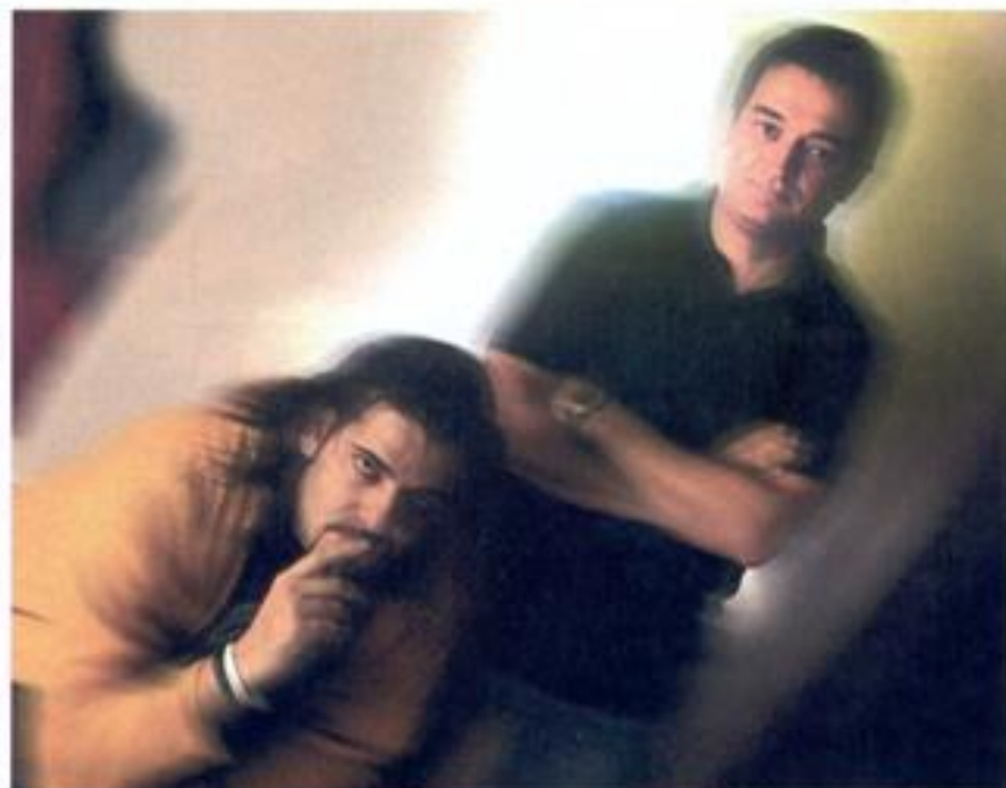
"UN 'SET' NO VAS A PADECERLO, VAS A DISFRUTARLO".

R. "Eso va con la filosofía que te he dicho antes; las cosas se hacen para disfrutar. Grabamos el videoclip y nos lo pasamos fabulosamente; estábamos los tres disfrutando enormemente... Incluso grabando. Las cosas no se hacen para aparentar".